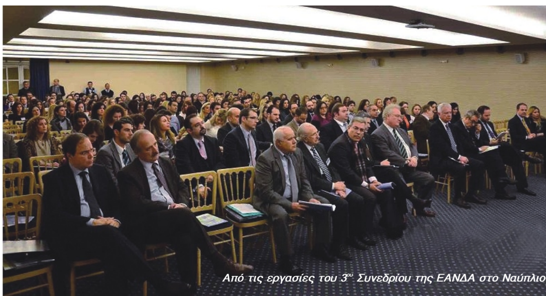
Από τις εργασίες του 3 ου Συνεδρίου της ΕΑΝΔΑ στο Ναύπλιο