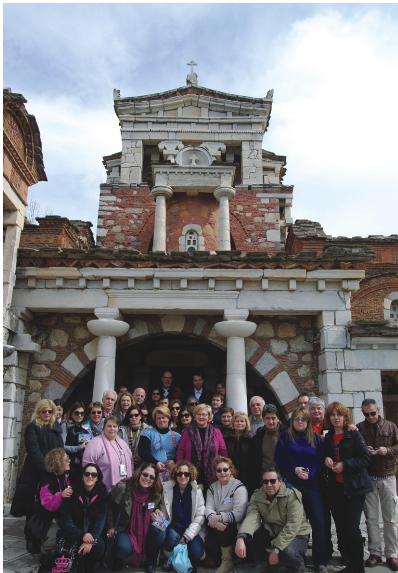
Οι εκδρομείς μπροστά στην Αγ. Φωτεινή.

Για το λόγο αυτό, όσοι συνάδελφοι επιθυμούν να συμμετάσχουν στην παραπάνω εκδρομή, μπορούν να εκδηλώσουν το ενδιαφέρον τους –χωρίς καμία απολύτως υποχρέωσή τους– αφού επικοινωνήσουν με τον υπεύθυνο σχεδιασμού των εκδρομών του ΔΣΑ στο κινητό 6932 378480 ή με αποστολή email στο aloupyiannis@yahoo.com