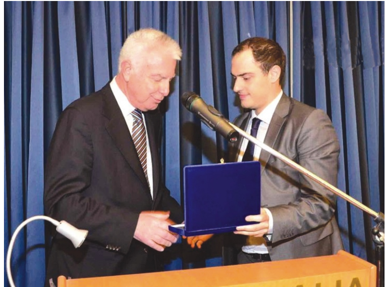
Ο Πρόεδρος της ΕΑΝΔΑ κ. Γ. Κώτσηρας απονέμει τιμητική πλακέτα στον Πρόεδρο του Συμβουλίου της Επικρατείας ε.τ. και πρώην Πρωθυπουργό της Ελλάδος κ. Π. Πικραμμένο.

Ν. Κλαμαρής, Ομότιμος Καθηγητής Νομικής Σχολής Παν/μίου Αθηνών, τ. Πρόεδρος Τμήματος Νομικής Σχολής Αθηνών